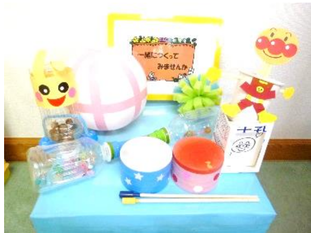
他にもいろいろ作ろう！