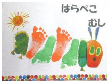
足形アートを作ろう！