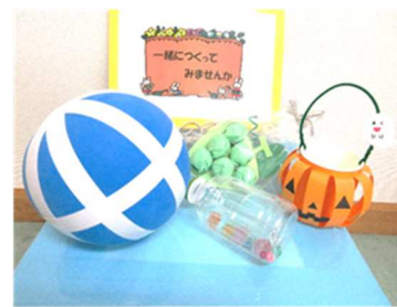
他にもいろいろ作ろう！