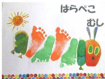
足形アートを作ろう！