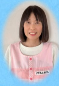
児童発達支援 管理者

子どもの発達途中は、心身ともに伸びる時期です。「たけのこ」は、芽を見つけて日に日にぐんぐんまっすぐに伸びていきます。正に当施設は、「たけのこ」の様にどのお子さんも伸びる支援をして行きたく、スタッフ一同「よいしょ」と持ち上げて参ります。