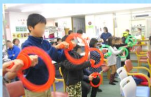
フラバンド 有酸素運動